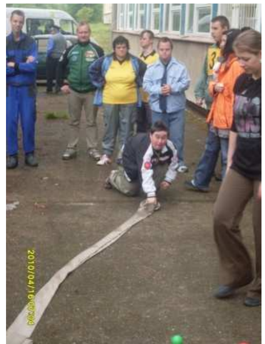
Speciální hasičská olympiáda