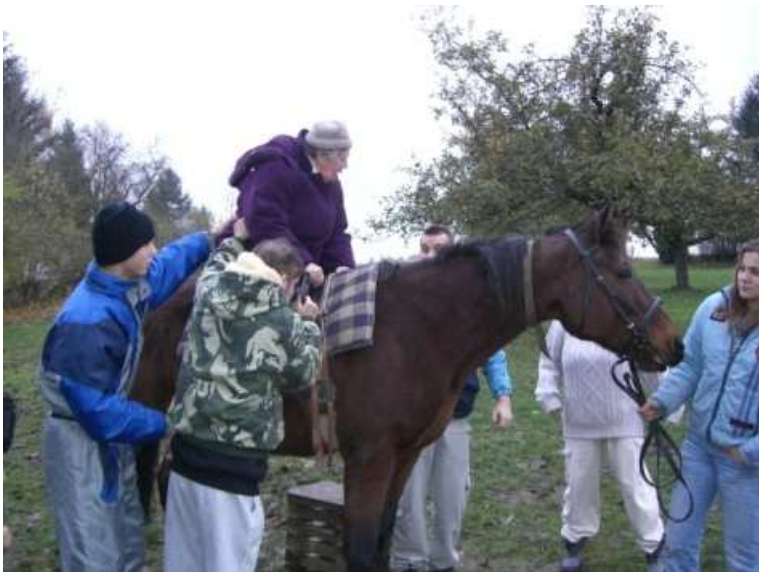
Hippoterapie ve Starých Křečenech